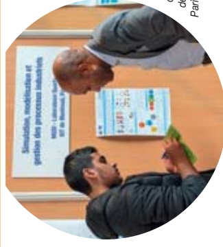
Sur le stand de l'IUT de Montreuil Paris 8