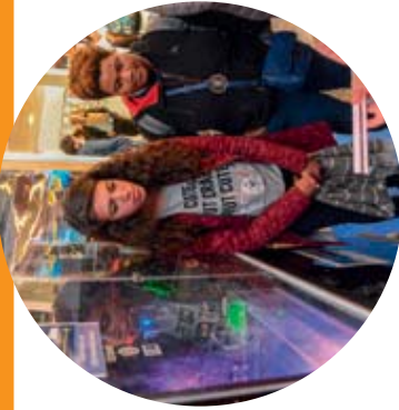
Laboratoire de Physique des Lasers (LPL), Paris 13 - CNRS