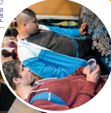
Femmes Tech - entreprise B4E, CINOV, FAFIEC - Concepteurs d'Avenir, ville de La Courneuve