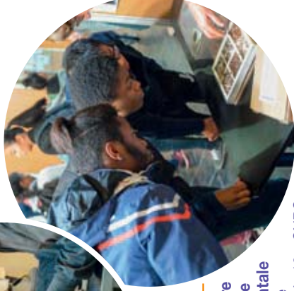
Laboratoire d'Éthologie Expérimentale Comparée (LEEC), Paris 13 - CNRS