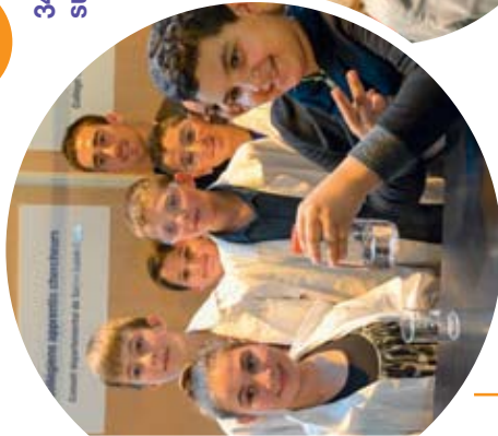
Collégiens apprentis chercheurs Collège Olympe de Gouges (Noisy-le-Sec)