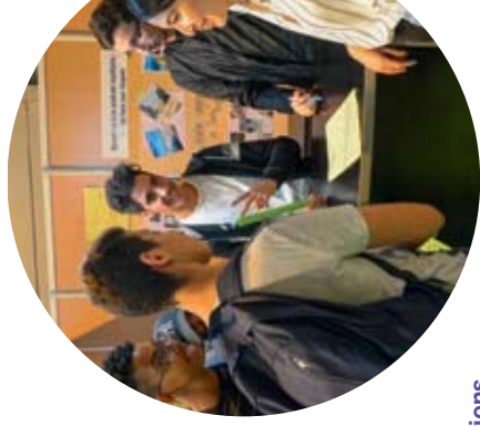
Lycée Suger, Saint-Denis