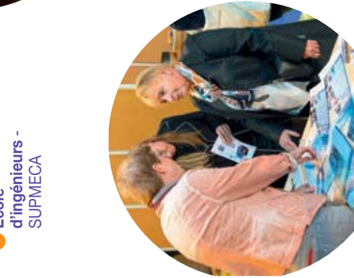
École d'ingénieurs - SUPMECA