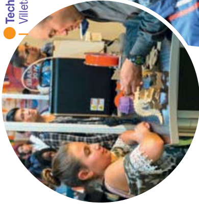
Technolab - IUT de Villetaiseuse Paris 13