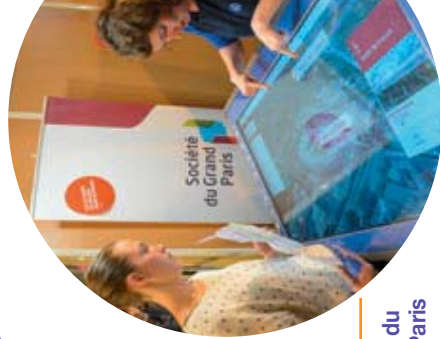
Société du Grand Paris