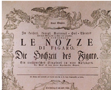
Les noces de Figaro (partition)