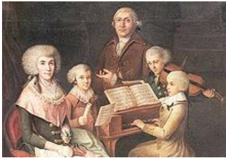
La famille de Mozart