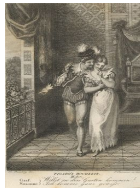
Les noces de Figaro