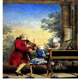
Mozart et son père