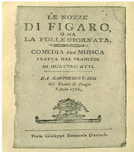
Les noces de Figaro (livret)