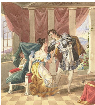
Les noces de Figaro