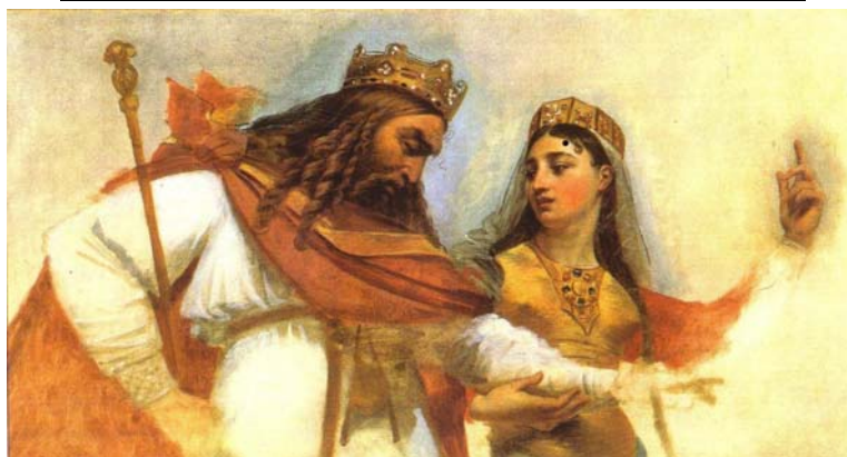
Clovis et Clothilde, tableau de Antoine-Jean Gros vers 1811-1812

Cette mini-conférence s'adresse alors à tout public dans une approche historique en relation avec la construction européenne.